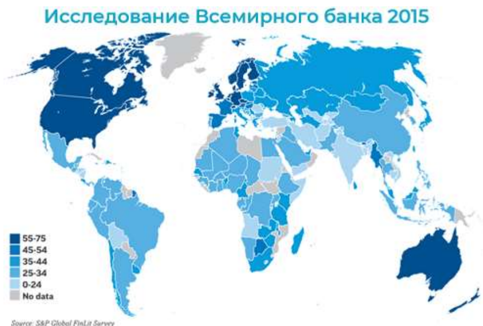
Рисунок 1. Доля (%) финансово грамотных взрослых по странам

Разные международные организации изучают уровень финансовой грамотности по всему миру. Так, в 2015 году Всемирный банк оценил владение базовыми финансовыми концептами в 140 странах мира (Рисунок 1). Оказалось, что от 13 до 71% взрослого населения смогли показать знание основных расчетов, образования процентов, инфляции и диверсификации рисков. Это лишь часть финансовой грамотности, и позже вы это увидите.